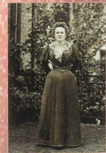
Clara Zetkin-1910 1ère femme à suggérer une journée internationale des femmes